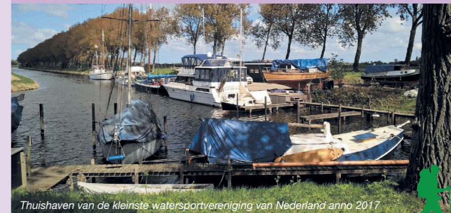
Thuishaven van de kleinste watersportvereniging van Nederland anno 2017

Het haventje met weegbrug was voorheen verbonden met het Arnemuidse Gat tussen Nieuwland en Walcheren. Tot de jaren vijftig van de 20e eeuw werden er landbouwgewassen, kolen en bouwmaterialen verscheept. Nieuwlanders vormden 'kaai ploegen', die voor het laden en lossen zorgden. Het laden van suikerbieten gebeurde met kruiwagens. De mannen werden de "Peekruuers" genoemd. De ploegbaas maakte een gezamenlijk werkcontract, dit was vrij uniek voor die tijd. Het loon werd op zaterdagavond uitbetaald.