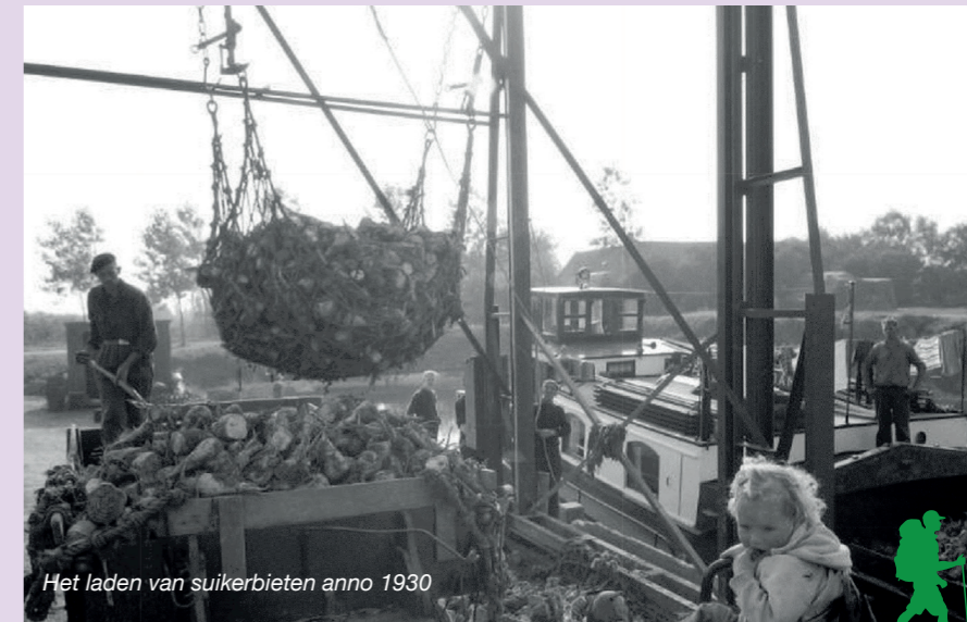
Het laden van suikerbieten anno 1930

Ter hoogte van de toegang naar de begraafplaats bevindt zich een gemetselde duiker. Dit is een historisch sluisje en heet de Waaienburgsluis. Het is een kokervormige constructie, gelegen in een weg, die is bedoeld om wateren met elkaar te verbinden. Ook kan een duiker worden aangelegd indien een waterweg een watergang kruist. Bij een duiker wordt in principe de bodem van de watergang onderbroken, dit in tegenstelling tot een brug of aquaduct. Wanneer je de Zaagmolendijk afloopt richting de Zaagmolenpolder kom je aan ook aan beide kanten van de weg een gemetselde doorgang/duiker tegen.